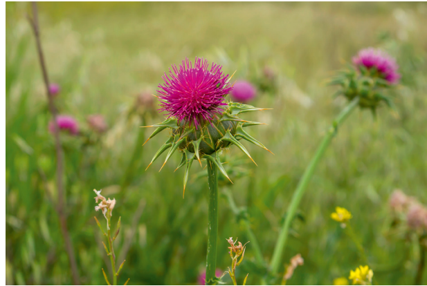
Die Mariendistel: Ideal für Leber und Galle

Möchten wir uns nach den Prinzipien der chinesischen Ernährungs- und Heilpflanzenlehre versorgen, müssen wir nicht unbedingt auf asiatische Pflanzen zurückgreifen. Auch unsere natürliche heimische Umgebung hält höchstpotente Pflanzen bereit – für die Regeneration von Leber und Gallenblase hat sich etwa die Mariendistel als besonders wirksam erwiesen.